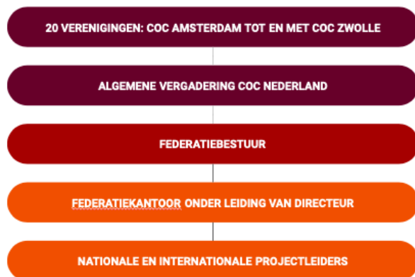
Federatie COC Nederland schematische structuur

Elke COC-vereniging heeft op de AV een aantal stemmen, dat afhangt van de grootte van de vereniging. De inbreng van onze vereniging op deze AV wordt voorbereid door ons bestuur.